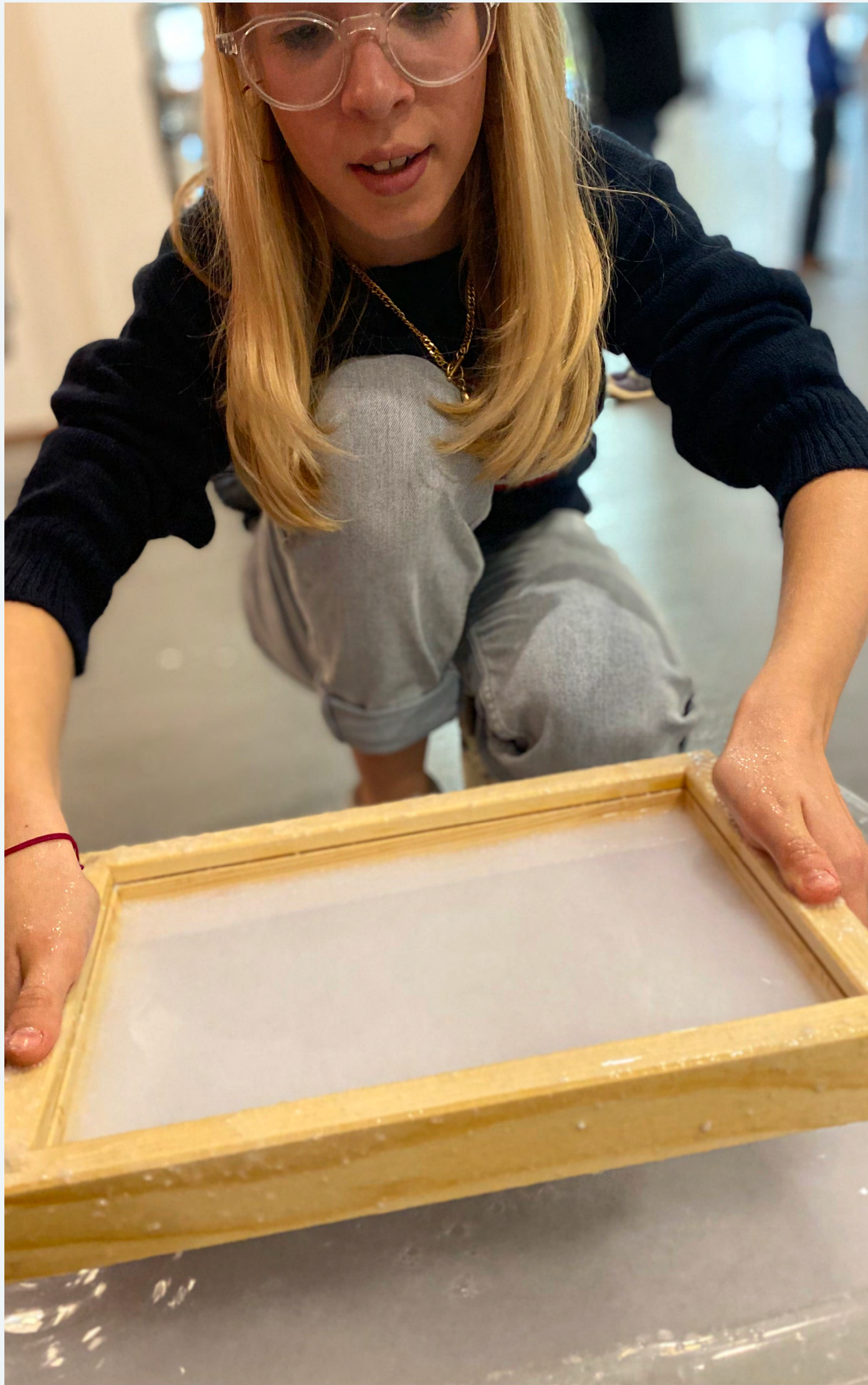
Papier scheppen tijdens de Rotterdamse burendag.