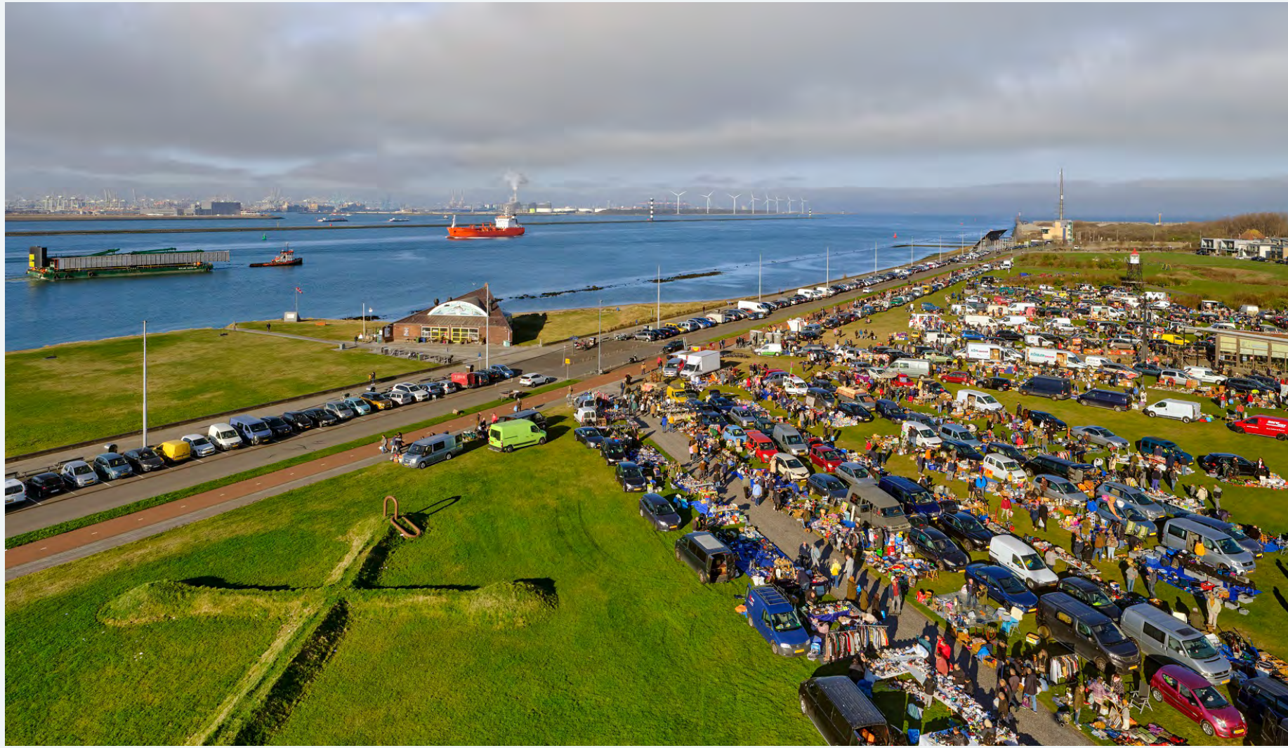
Trunksale/Kofferbakverkoop in Hoek van Holland (2022).