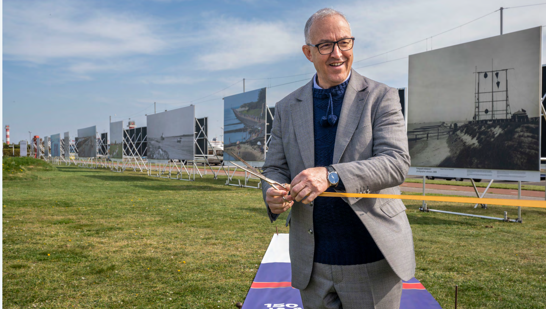
Burgemeester Aboutaleb opent de tentoonstelling 'REUZENARBEID. De Nieuwe Waterweg in 150 jaar fotografie' te zien van 28 maart t/m 30 september 2022.